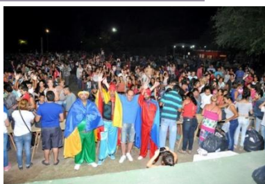
Los Reyes Magos llegaron al Balneario